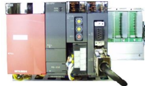
代替 PLC (三菱電機製『Qシリーズ』)

1998年1月～2005年11月生産のYTC-E型・YTC-ED型に使用されているパナソニック製 PLCおよび1998年1月～2002年8月生産のYTC-D型・YTC-I型・AYF型に使用されている三菱電機製 PLCは、下記枠内のスケジュールで製造中止もしくは保守対応終了されます。